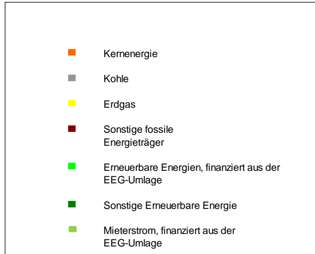
Stromerzeugung 2019 in Deutschland - Durchschnittswerte zum Vergleich